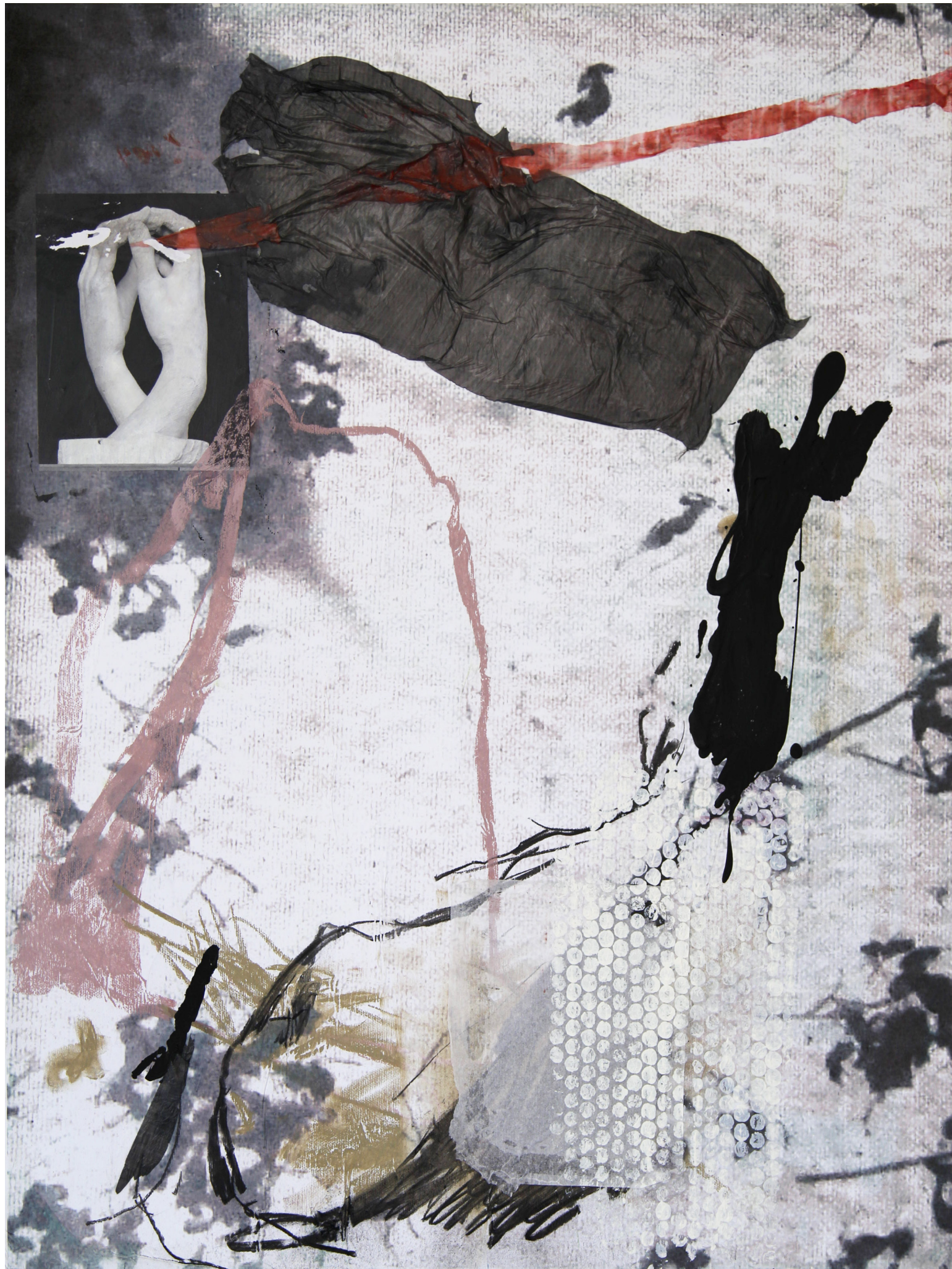
Brez naslova, 2018, mešana tehnika na platnu, 80x60 cm